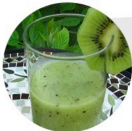
▲ SMOOTHIE KRAZY KIWII (Livre de Cuisine des Smoothies – p.15)