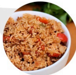
▲ RIZ ESPAGNOL (Livre de Cuisine des Accompagnements – p.34)