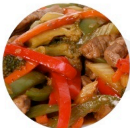
▲ SAUTÉ DE BŒUF AUX POIVRONS (Livre de Cuisine de Viande Rouge – p.23)