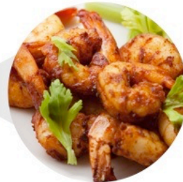
▲ CREVETTES AU PAPRIKA (Livre de Cuisine de Poisson et Crustacés – p.10)