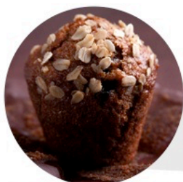
▲ MUFFINS AU CHOCOLAT BEURRE DE CACAHUÈTES ET AVOINE (Livre de Cuisine des Petits Déjeuners – p.24)