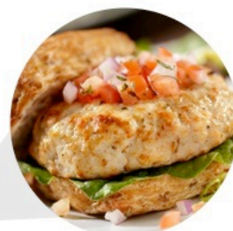
▲ BURGERS ASIATIQUES À LA DINDE (Livre de Cuisine de Poulet et Volailles p.4)